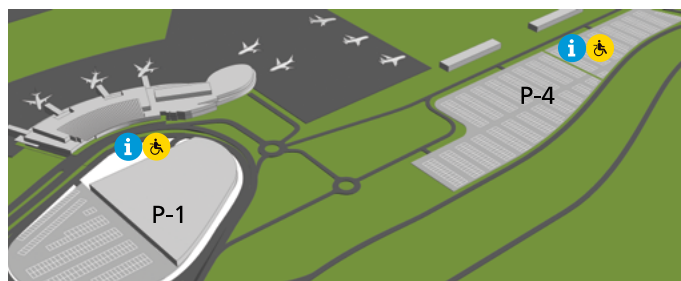
Accesos y aparcamiento